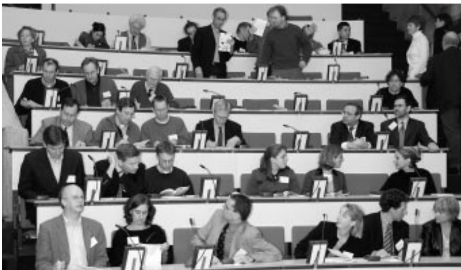
Symposium 'Van voorhoorncel tot spier: richtlijnen voor de praktijk', 10 januari 2003

Jaarlijks symposium Stichting Onderzoek Neuromusculaire Ziekten/Boerhaave Commissie